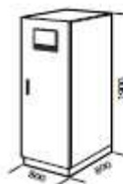
MIM 30 - MIM 40